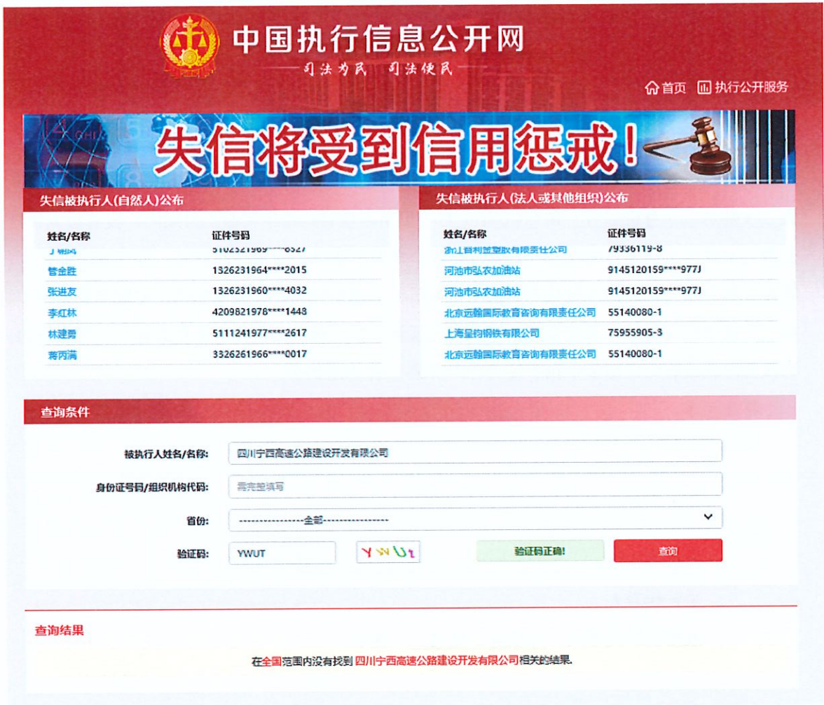
“信用中国”网站中比选申请人（单位）失信被执行人名单记录的查询网页截图示例